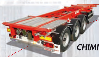
CHIMIQUE 20', 30'

Mise en œuvre de conteneurs spécialisés, frigorifiques, citernes chimiques, vracs