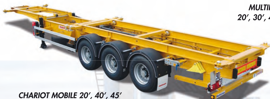
CHARIOT MOBILE 20', 40', 45'

Nécessité de polyvalence avec prise en charge de nombreux conteneurs par un seul châssis