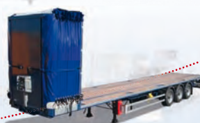
OPEN BOX C+