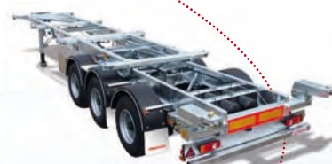
SLIDING 20', 30', 40', 45'